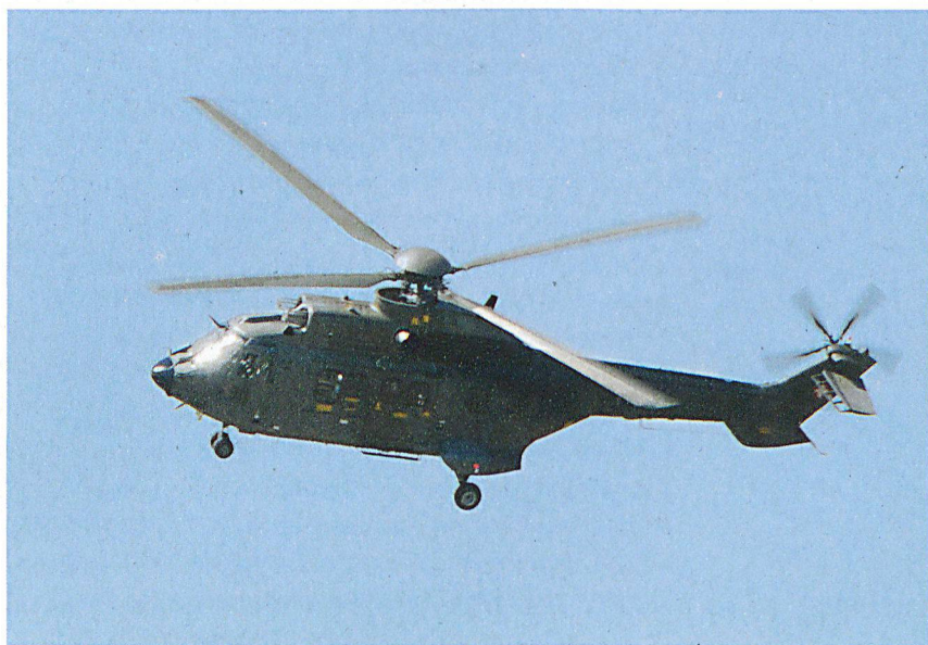
Der Super Puma im Einsatz für die Nationale Alarmzentrale NAZ.