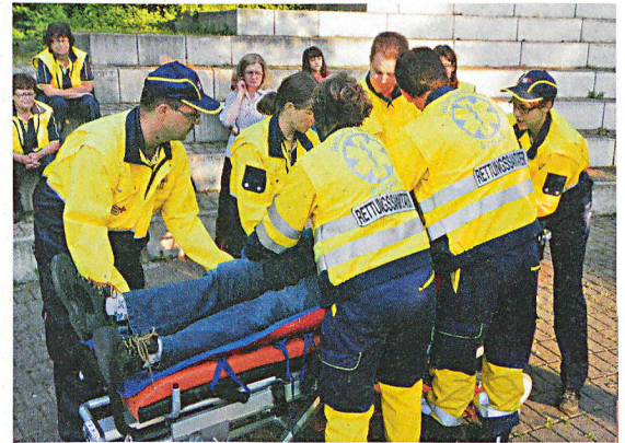
Die Zusammenarbeit mit dem Rettungsdienst ist das Thema der diesjährigen Weiterbildung der Ausbildungskader der Samaritervereine. Das Bild entstand an der Weiterbildungstagung der Thurgauer Samariter.