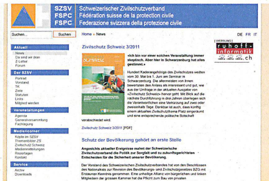
Eine zentrale Rolle in der Kommunikation spielt auch beim SZSV die Website.

Weiterführende Link: www.zivilschutz-schweiz.ch