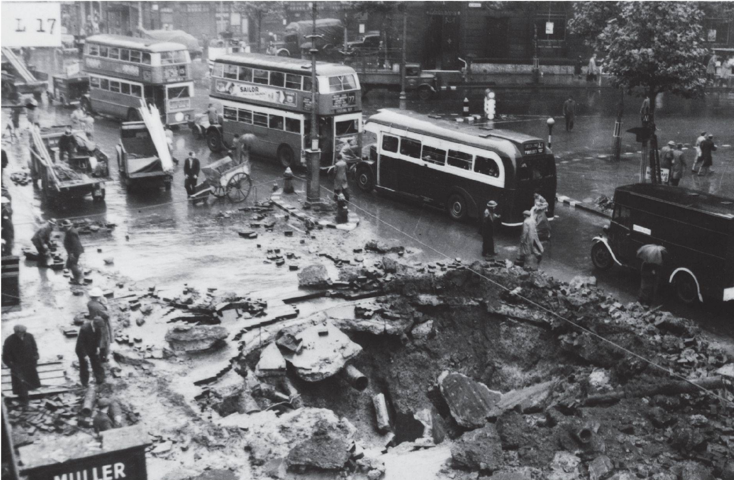
Bombentrichter in London nach einem deutschen Luftangriff.