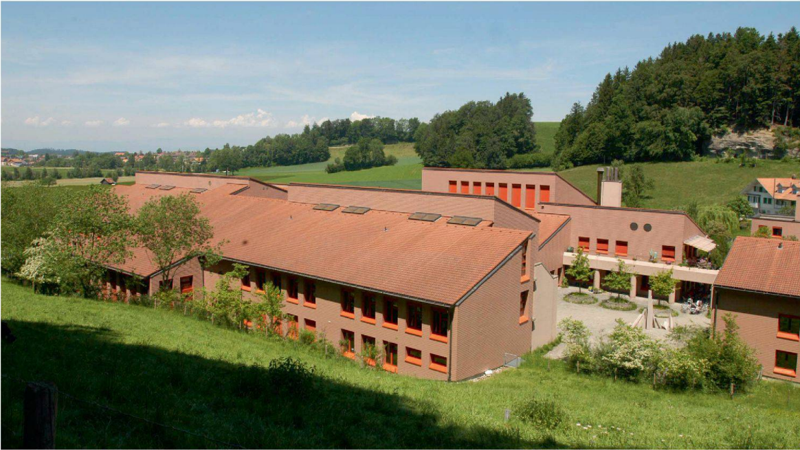
Erste Ausbautetappe des Eidgenössischen Ausbildungszentrums in Schwarzenburg.