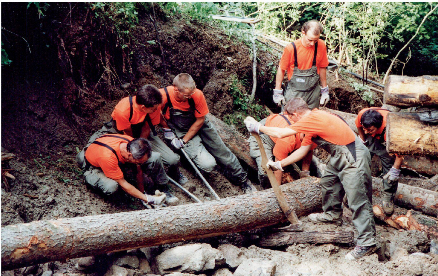
Zivilschutz-Einsatz nach einem Unwetter.

Im Zivilschutz-Leitbild vom 26. Februar 1992 wurden unter Berücksichtigung des Ausbaustandes und der neuen Gewichtung der Katastrophen- und Nothilfe – nicht zuletzt auch aus finanzieller Sicht – drei Umsetzungsprioritäten festgelegt: 1. Ausbildung, 2. Ausrüstung (Material), 3. Schutzbauten. Diese Prioritäten bestimmten das Handeln in den Folgejahren, und sie erwiesen sich als sinnvoll. Anfänglich bot es grosse Schwierigkeiten, die Katastrophen- und Nothilfe in der Kaderausbildung umzusetzen. Das Beharrungsvermögen der an die systematische und eher starre Ausbildung für den Fall eines bewaffneten Konflikts gewohnten Instruktoressen war beträchtlich. Die neuen Aspekte verlangten deutlich grössere Flexibilität. Hervorzuheben ist die neue persönliche Ausrüstung; diese trug unbestreitbar vieles zum besseren Erscheinungsbild und Ansehen des Zivilschutzes bei. Deutlich wurde