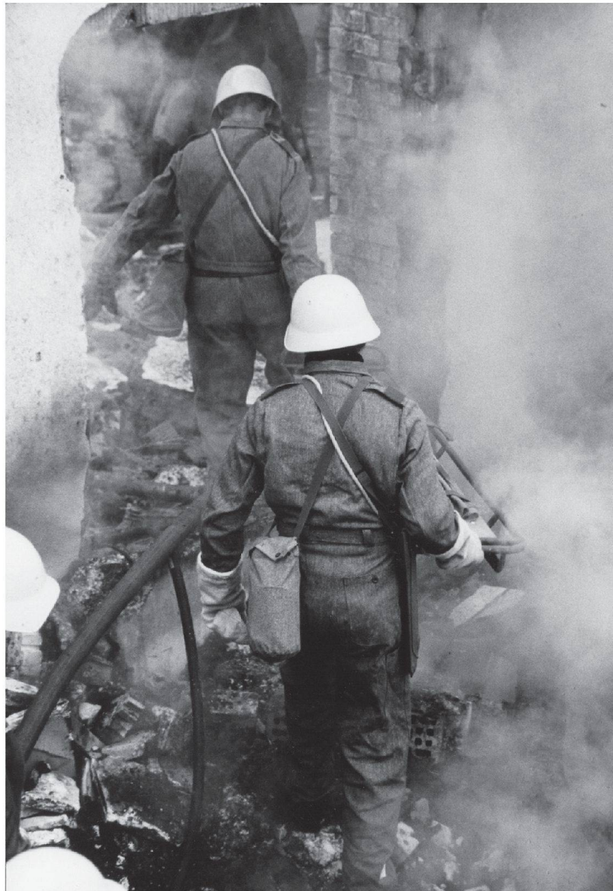
Zivilschutz-Einsatzübung in der Aera der blauen Überkleider und der gelben Helme.

Bahnbrechend war aber vor allem, dass es einigen aussergewöhnlich engagierten Bauingenieuren und anderen Experten gelang, wissenschaftlich fundierte Grundlagen für einen zeitgemässen Zivilschutz, vor allem für einen modernen Schutzraumbau, zu erarbeiten.