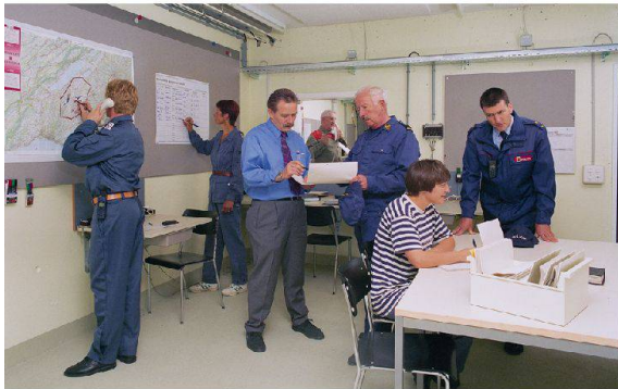
Szene aus einem Stabskurs im Eidgenössischen Ausbildungszentrum in Schwarzenburg.

die Unterschiede beim Stand des Zivilschutzes zum Teil das Mass dessen sprengen, was als Tribut an den föderalistischen und der Gemeindeautonomie Rechnung tragenden Aufbau des Zivilschutzes vertretbar ist». Tatsächlich glich sich der Ausbaustand des Zivilschutzes erst gegen Ende der 1980er-Jahre gesamtschweizerisch einigermassen an.