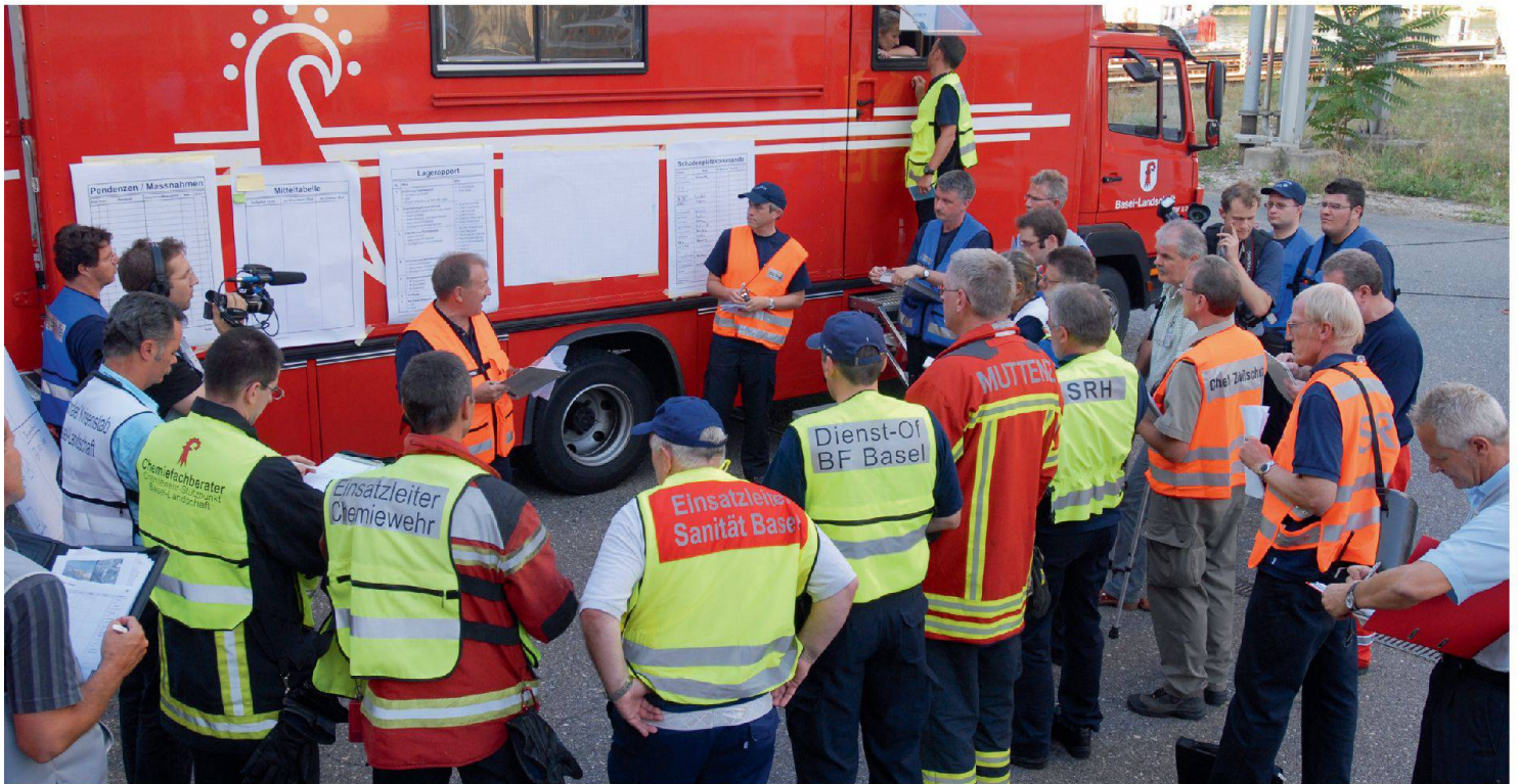
Einsatzbesprechung während einer Verbundübung.