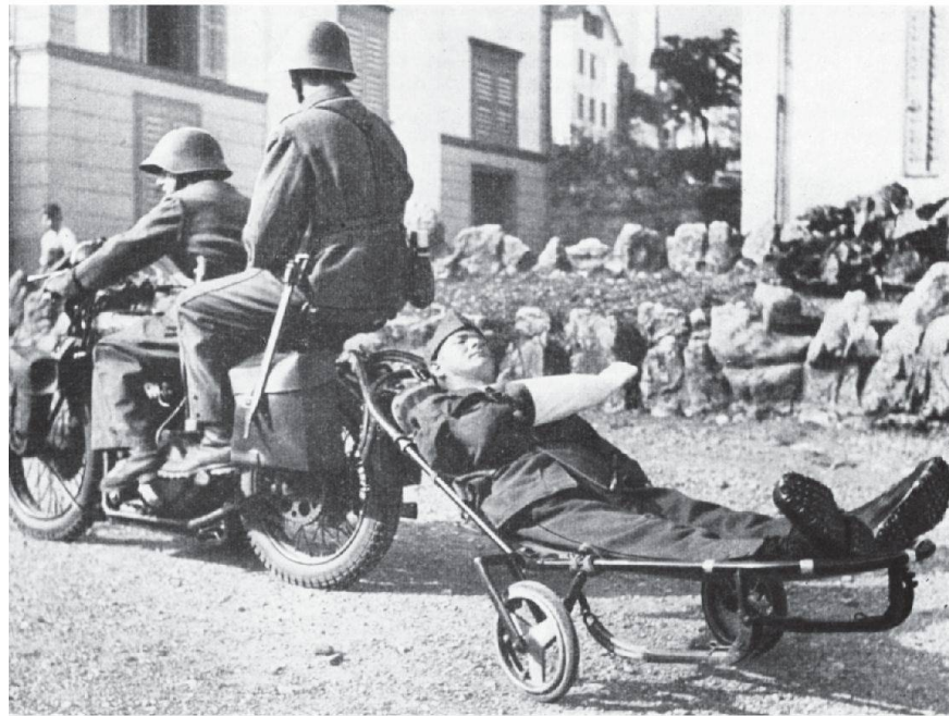
Rettungsübung während des Zweiten Weltkrieges: Transport eines «Verletzten».

Hitler war 1933 nach dem Sieg der Nationalsozialistischen Deutschen Arbeiterpartei (NSDAP) bei den Wahlen zum Reichstag von Reichspräsident Paul von Hindenburg zum Reichskanzler ernannt worden. In Deutschland liefen die Vorbereitungen zum Krieg.