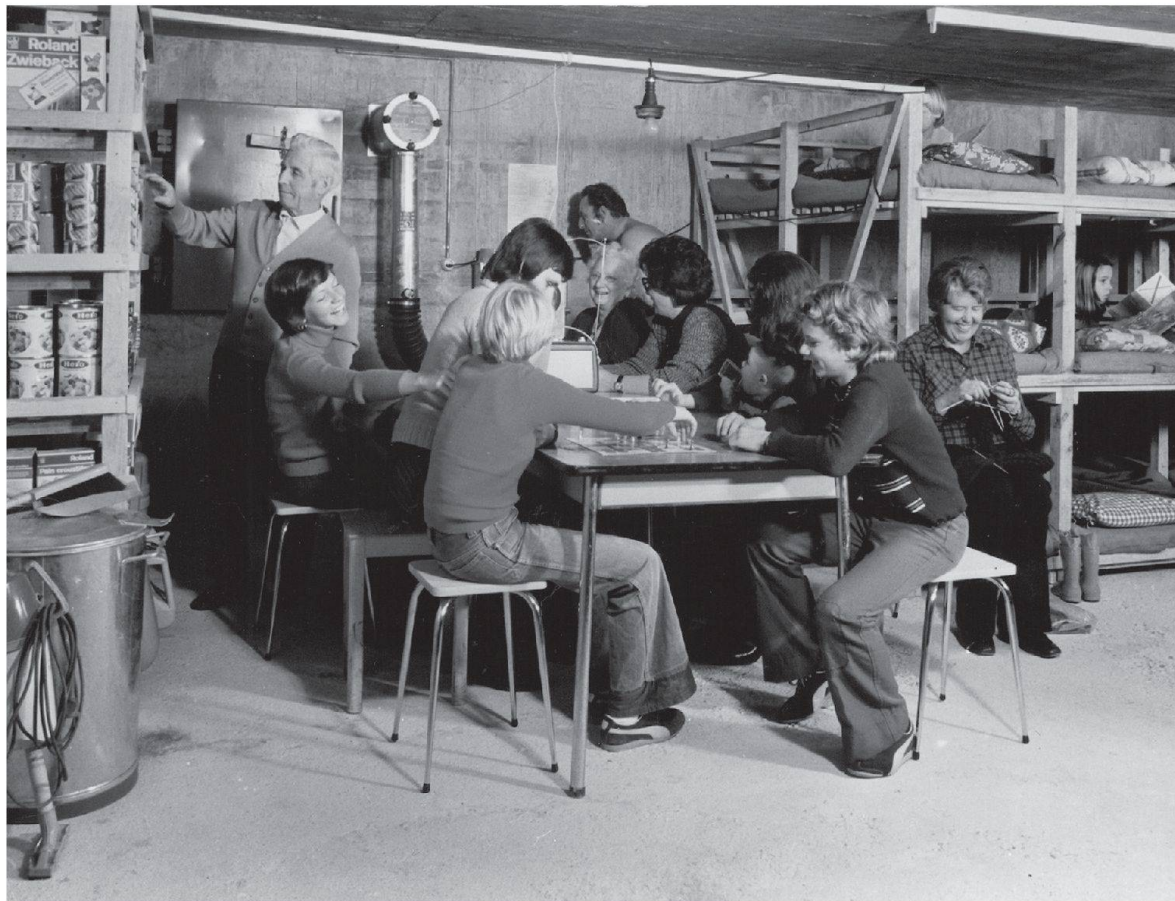
Etwas zu idyllische Szene aus einer Schutzraum-Belegungsübung in den 1970er-Jahren.

Für die organisatorischen Belange und für die Ausbildung fehlten bis gegen Ende der 1970er-Jahre geeignete, praxistaugliche Grundlagen. Die Führung und die Betreuung im Ernstfall wurde – wenn überhaupt – nur rudimentär und mithilfe dauernd wechselnder Ausbildungsunterlagen geschult.