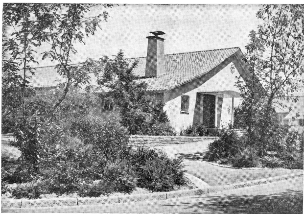
Lebendige Partie aus der besiedelten Grünzone in Zürich 11: Schulpavillon Saatlén in Schwamendingen. Architektur: Stadtbaumeister Albert H. Steiner. Gartengestaltung, Entwurf und Bepflanzung: Georges Boesch.