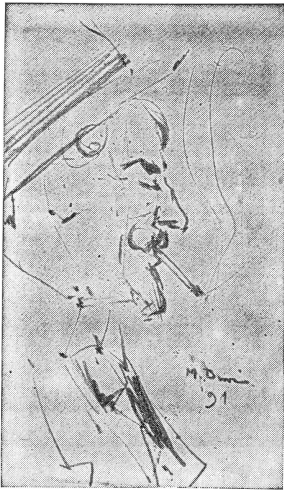
Die Cigarette · Zeichnung v. Max Buri, 1891 Berner Kunstmuseum