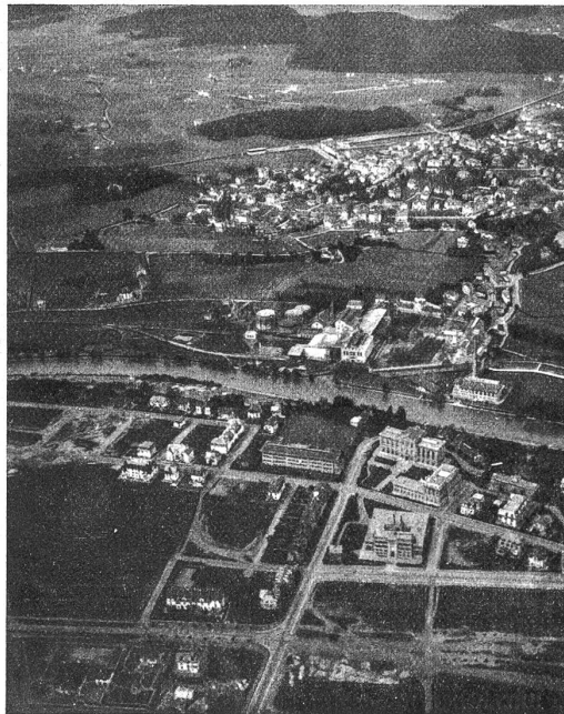
Bern Gasanstalt und Sülplaz, im Vordergrund eidg. Archiv- und Münzgebäude.

Jetzt ist Windstillstand und die Täuschung vollkommen, daß wir über dem Eismeer schweben. Da gibt es Gletscherküsten mit blau schillernden Abbrüchen, gefrorene Felder, auf die man aussteigen möchte, um Schlittschuh zu laufen, in blauen offenen Buchten treibende Eisberge und von ferne streift ein weißes Segel her, das Schiff einer Nordpolerpedition, nein, eine Wolke. Nun säckelt die Luft leicht durch dieses Zauberland, über das sich ein Himmel, blauer als derjenige