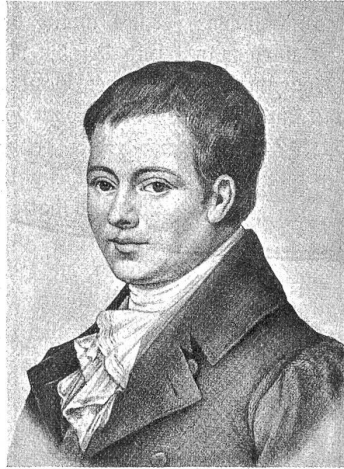
Heinrich von Kleist. (Jugendbildnis.) Nach einem Oelgemälde von 1800.

war hier in der Schweiz abgeschlossen worden, die Unreise desselben fühlte aber Kleist so stark, daß er sofort von einer „elenden Scharsteke“ sprach, und doch genießen wir noch heute