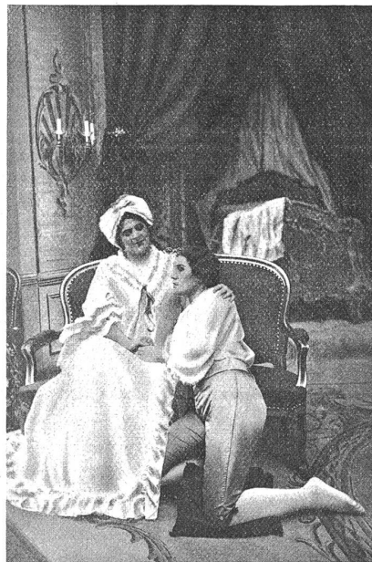
Berner Stadttheater: Szene aus „Rosenkavalier“.