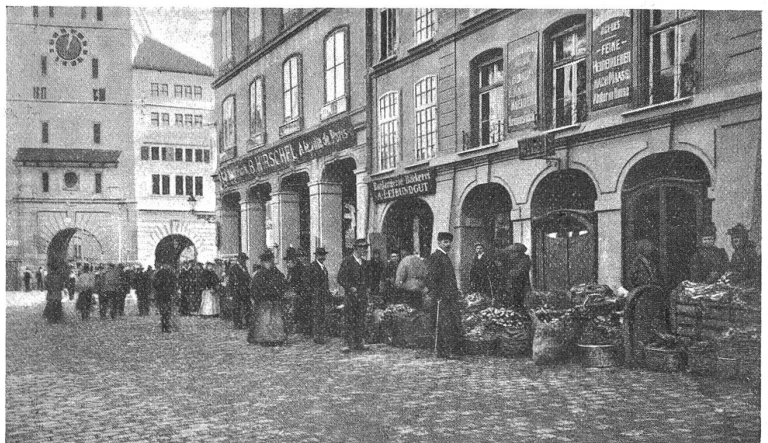
Der „Ziebelemerit“ in Bern.