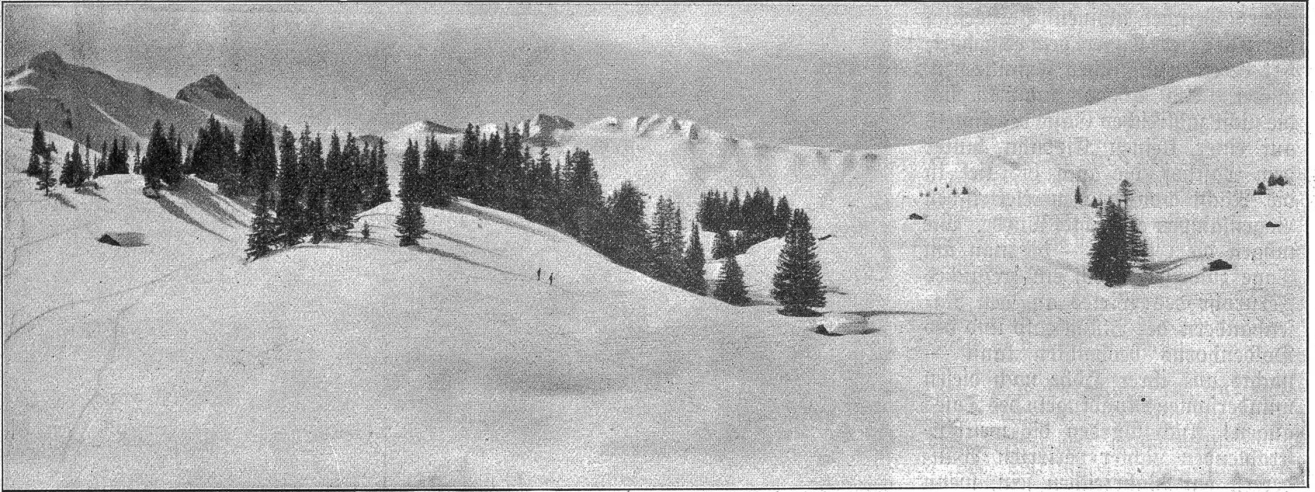
Winter in Adelboden.

Noch nicht vermochte die Sonne — es war elf Uhr vor- mittags — in den Talgrund zu dringen; doch beleuchtete sie die nahen Berge mit ihrem freundlichen Lichte. Auch war die Luft hier weniger kalt; obwohl vom Aufstieg in Schweiß gebadet, spürte ich kein Frösteln und genoss die Einsamkeit des hehren Gebirgstales wohl eine Viertelstunde lang.