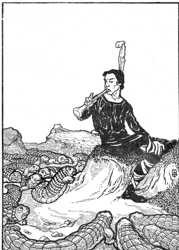
Der Zauberer und die Stollenwürmer.

Lawinsturz und nächtliche Föhnstürme verkörperte es in Geister-Dämonen. Die Kunde von diesen Gefahren, die den Alpenbewohner beständig bedrohen, hielt ja die Menschen der Ebene bis an die Schwelle des 19. Jahrhunderts im Bann; man wagte es nicht, in dieses Land der Abgründe und Gletscherschlünde hinaufzusteigen. Wie schreckhaft noch lauteten die Berichte eines Benvenuto Cellini über das Reisen in dieser Gegend; ein Haller und ein Göthe mußten zuerst schreiben, bevor der Bann gebrochen und der Fremdenstrom zu fließen begann.