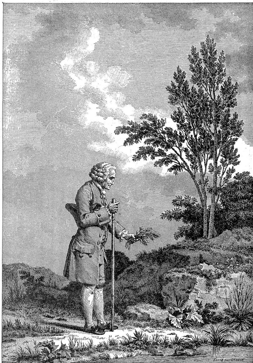
Rousseau auf dem Felde.

Während der drei Jahre, da Rousseau in der Verborgenheit des Traverstales weilte, fing er an, mit Leidenschaft Botanik zu studieren. Er ließ sich von seinen Buchhändlern den Linné und andere botanische Werke zusenden. Auf der Jagd nach Blumen durchstreifte er den Neuenburger Jura weithin nach allen Richtungen, und in den kurzen glückseligen Wochen auf der Petersinsel im Bielersee hielt er sich außer den botanischen alle Bücher vom Leib. Er wußte gar wohl, daß er in der Pflanzenkunde ewig ein Dilettant bleiben werde, solches hinderte ihn nicht, sich ihr bis in die letzten Alterstage zu widmen. Die Botanik war ihm ja doch nur Vorwand seines unerfülllichen Wandertriebs, und mit C. F. Meyer hätte er von seinen Wanderfüßen sagen können: