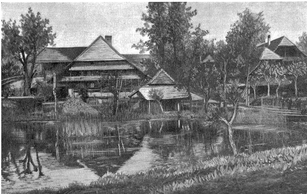
Herzwil. An dem Feldsträßchen von Köniz nach Thörishaus gelegen.

So weit Schwester Arendt über Kinderklaven in Europa. Es gibt noch mildere Formen des Kinderklaventums, als die eben geschilderten, die den Anstoß gaben zu der großen Frauen- und Kinderschutzbewegung unserer Tage. Die zahlreichen Zweigvereine des großen Bundes, der edelgedenkende Menschen zum Schutze der bedrohten Schwachen und Hilflosen verbindet, sind bestrebt, Mißhandlung und Verwahrlosung, Entrechtung und Herabwürdigung, begangen an Frauen und Kindern, in welcher Form sie sich zeigen, aufzudecken, zu sühnen und aus der Welt verschwinden zu lassen. Vor kurzem hat sich ein schweizerischer Verein für Frauen- und Kinderschutz gebildet und in unserm Kanton ist diesem Verein eine große Sektion erstanden. Wir werden später an dieser Stelle von ihrem segensreichen Wirken berichten.