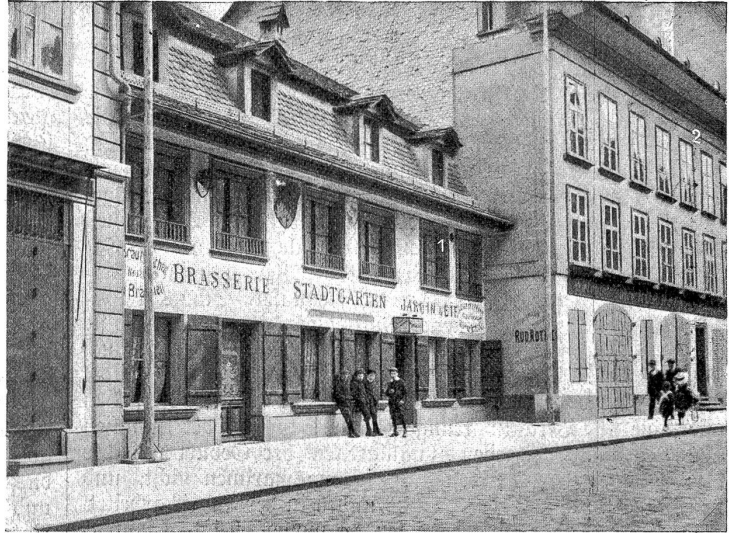
Der „Stadtgarten“ in Bern.