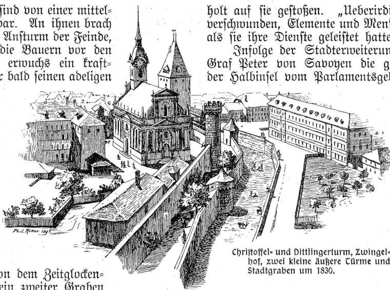
Christoffel- und Dittlingerturm, Zwingelhof, zwei kleine äußere Türme und Stadtgraben um 1830.

Am Holländerturm auf dem Waisenhausplatz dürfte der viereckige Aufbau aus neuerer Zeit sein, der alte Rundturm dagegen aus savoyischen Tagen stammen; an Stelle des Marziliturms steht jetzt der Pavillon des Hotels Bellevue gegen den Münzrain zu, auf dem Platz des alten Aareturms die „Fridau“, von der aus jetzt die alte Lezi oder Stadtmauer zur Münze hinauffsteigt. Ganz verschwunden sind der Schindelsturm an Stelle des heutigen Parlaments-