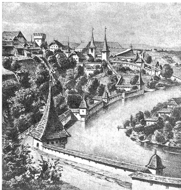
Längmauer mit Kuttel- und Harnischturm, im Hintergrund der nördliche Teil der Stadtmauer von 1340 vom Cillierturm zum Golattenmattgäßli. Zustand im Jahr 1676.