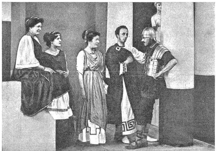
Kunsthalle-Bazar in Bern: Römer und Pompejanerinnen.