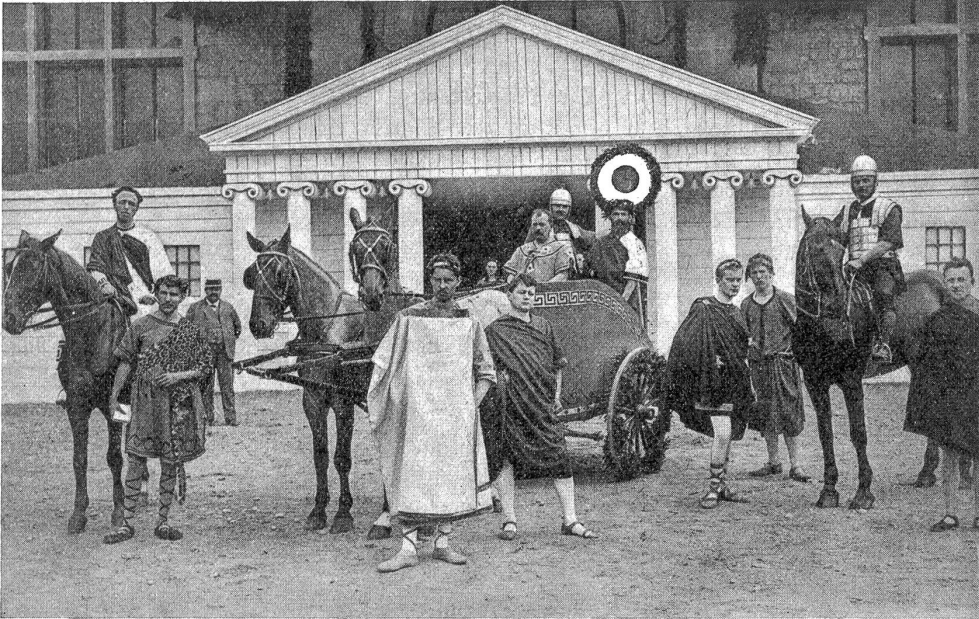
Kunsthalle-Bazar in Bern: Gruppe aus dem Umzug vor dem Vorbau.