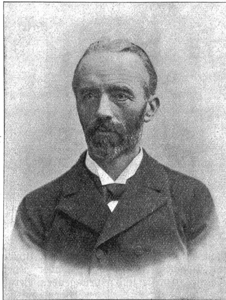
Prof. Dr. Theodor Kocher.

Wie man uns mitteilt, wurde dieses Jahr von einer eigentlichen Feier Umgang genommen, da eine solche nächstes Jahr