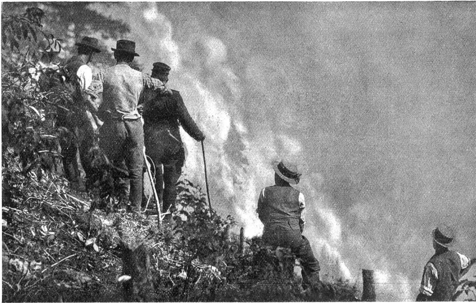
Brand an der Simmenthal.

richte die Zeit zur Flucht nur knapp, sodaß den Leuten Hut und Schuhsohlen abgeschlagen wurden.