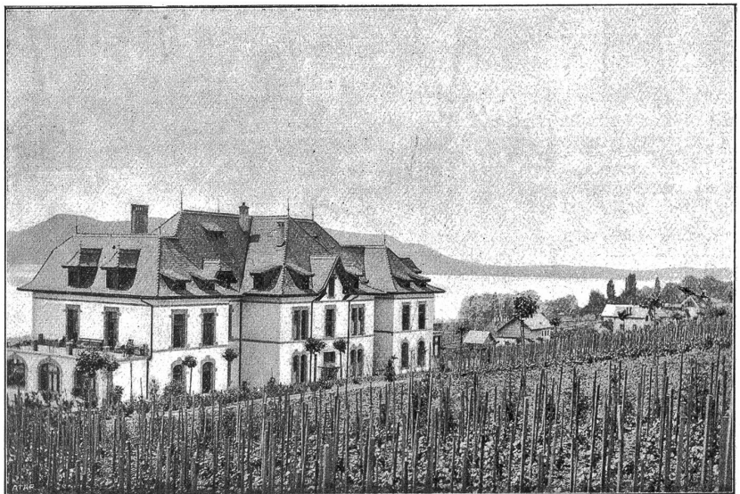
Asyl „Monrepos“ in Neuenstadt.

Die vereinigten Krankenasylls „Gottesgnad“ verpflegten im Berichtsjahre 495 Kranke. Von diesen 495 Kranken starben 98 und wurden nach Hause (teils als geheilt) entlassen 18, in andere Anstalten verlegt 9. Sie beherbergten im Durchschnitt im Tag 373 Kranke. An dieser Durchschnittszahl beteiligten sich: Weitenwil mit 72,4, St. Niklaus mit 80,9, Mett mit 37,7, Spiez mit 100 und Neuenstadt mit 82 Kranken. Die Zahlen zeigen, daß alle Filialen (das „erwei-