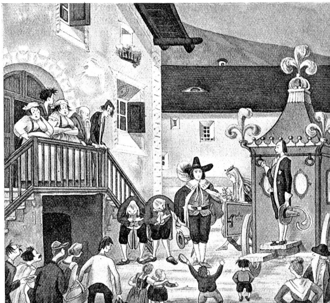
Eine prächtige Staatskarosse fuhr vor das Haus des Vaters.

Andreas stuzte wohl einen Augenblick, denn es war wahrhaftig keine Kleinigkeit, das gewaltige Tier siebenmal durch das ganze Haus zu schleppen — aber er machte sich doch an die Arbeit. Er zog und zog und mitunter schien es ihm unmöglich zu Ende zu kommen, aber er dachte daran, wieviel Gutes ihm das Tier schon getan und faßte immer wieder neuen Mut. So gelang ihm auch die schwerste Probe und nach einigen Stunden harter Mühe war die Arbeit getan. Als Andreas nun schwer atmend da stand und sich den Schweif von der Stirne wischte, gab es plötzlich einen furchtbaren Krach, als stürze der ganze Palast zusammen. Im gleichen Augenblick aber stand eine herrliche Jungfrau vor ihm, die ihm mit Tränen in den Augen für ihre Befreiung dankte. Sie trug eine Krone im goldblonden Haar und war so schön, wie Andreas noch nie eine Frau gesehen hatte. Mit lieblichem Lächeln faßte sie ihn bei der Hand und zeigte ihm nochmals alle Schätze ihres Palastes. Dann machten sie sich miteinander auf den Weg.