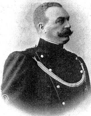
† Kapellmeister Georg Huber.

als 1. Violinist und Konzertmeister in der Kapelle Buchner und in den weltbekanntesten Gewandhauskonzerten in Leipzig. 1880 erfolgte sein Eintritt als Kapellmeister ins 5. Rheinische Infanterieregiment, bis er später ein eigenes Orchester gründete, das er 13 Jahre lang mit großem