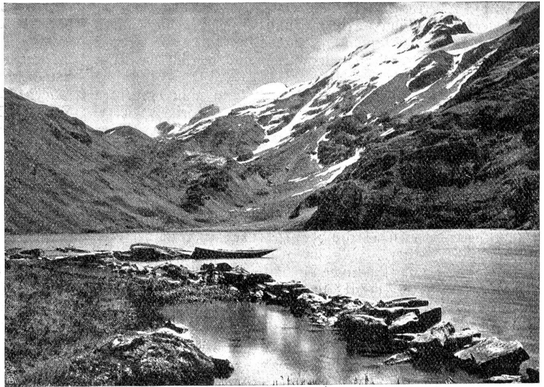
Der Engstlenjee, ein Idyll im Angesicht des stolzen Titlis, soll durch die Jochpäßbahn seiner träumerischen Ruhe beraubt werden.