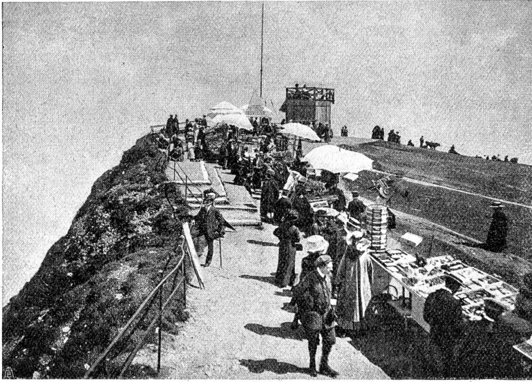
Auf Rigi Kulm. Der beschämende Jahrmart. „Fremdenindustrie“ im schlimmen Sinne auf dem schönsten Aussichtsgipfel der Zentralalpen.

Die Absicht liegt mir fern, die Schönheit der mühelos gewonnenen Aussicht abzuleugnen. Aber die Art der Empfindung des Wanderers und des gewohnheitsmäßigen Besuchers der Bergbahnen ist eine so total verschiedene, daß die Würdigung jener Schönheit bei den beiden nichts Gemeinsames hat. Vor wenigen Tagen bot sich mir neuerdings ein Beispiel, als ich den Weg vom Findelengletscher nach Kyffelpalp durchwanderte. Ich hatte i. Z. diesen bescheidenen Ausflug befreundeten Bekannten empfohlen, obgleich ich selbst nicht Gelegenheit gehabt hatte, ihn auszuführen. Ihre Enttäuschung war ebenso groß als meine neuliche Ueberraschung. Sie hatten die paar Steine, die diese Bergchauffee verunehnen, und die Glut der Sonne, welche durch lichten Waldbestand hindurchdringt, empfunden; die Schönheit der einzelnen Arven und Lärchen, wie sie in seltener Größe vorkommen, die Macht des Kampfes, den sie seit Jahrhunderten führen, die Fröhlichkeit der schäumenden Bäche, die ergreifende Ruhe des mitten in sonnbestrahlten Weiden errichteten Dorfes Findelen, hatten es nicht vermocht, sich der Seele der neugierigen, sensationsbedürftigen Spaziergänger zu offenbaren.