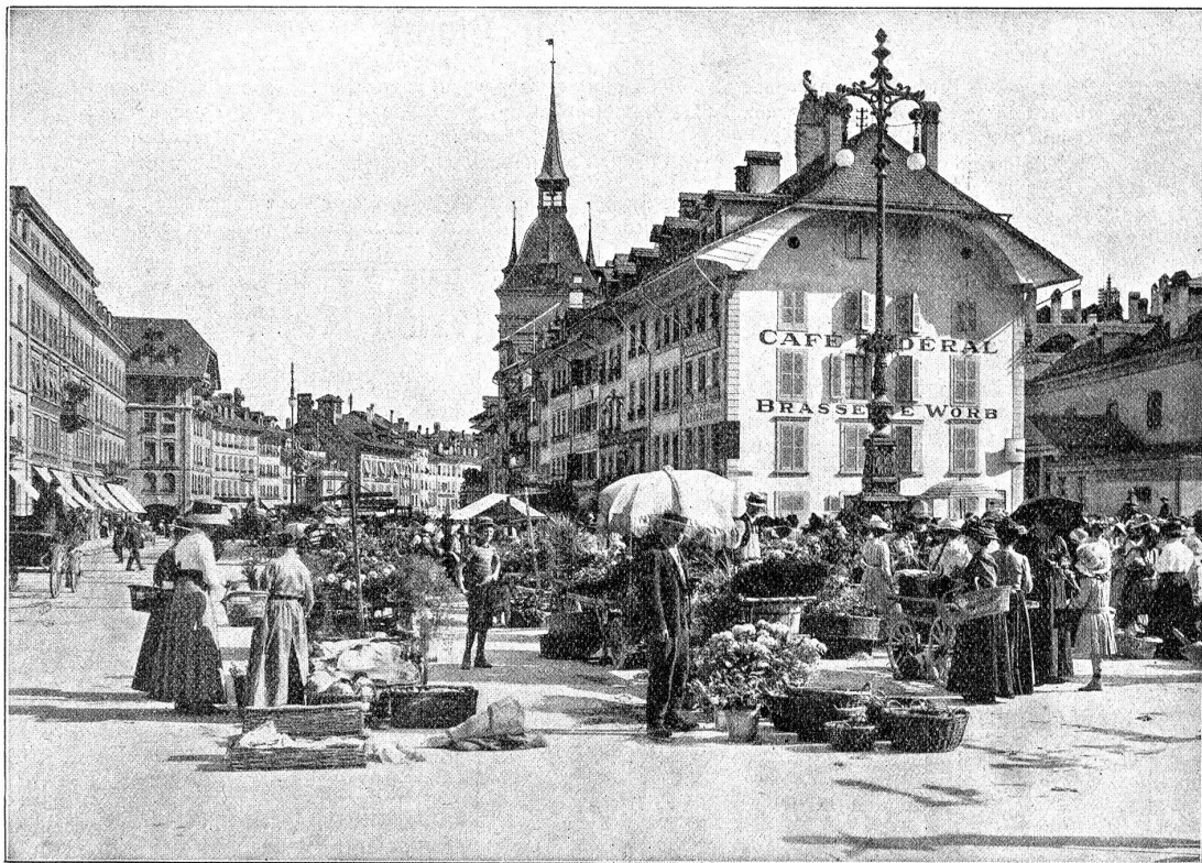
Der Markt auf dem Parlamentsplatz nach dem Bärenplatz hin.

Und andere Frauen kommen, niedliche, schlanke, kleine, dicke, runde und mollige. Solche die jung sind und die leichtfüßig gehen, und mit kecken, unbefangenen Blicken in die Welt schauen, denen der Himmel stets Sonnenglanz lächelt und denen jedes Lüftchen Musik ist. Und andere, zage, verängstigte, mit Schatten unter den Augen, mit ausgetretenen Schuhen an den Füßen und modelosen Hüten auf dem Kopf. Solche, die schnell in eine Ecke stehen und ihr Geld zählen und rechnen, nach dem Preis fragen und wieder rechnen, ehe sie kaufen. Aber eine Spezialität kommt, die keinen Markttag fehlt. Die Figur ist eher breit als hoch, hat einen Busen, wie das wogende Meer, Doppelkinn und dicke Backen. Sie hat Hühneraugen und geht vorsichtig auf Absätzen. Mit ihren Ellenbogen macht sie im dichtesten Gedränge Platz. Mit wütenden Blicken wirft sie um sich und in die dicksten Haufen dringt sie ein. Kommt ein Schulkind in ihre Nähe, hat es einen Puffer weg. „Chasch nid upasse, du Donners Schnüderi; — du hefch nid uf mine Füß glehrt laufe!“ — Alles prüft sie, alles greift sie an, beäugt und betastet sie, Gemüse, Obst, Fleisch, Käse, und wo es angeht, kostet sie davon. Wenn sie kauft, überbönt sie alle andern mit ihrer Stimme, die auf