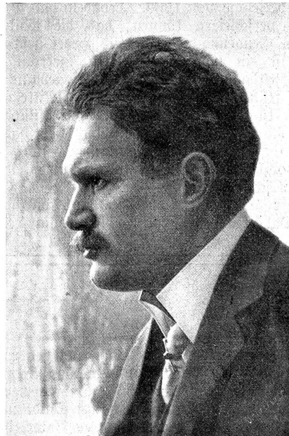
Prof. Felix Berber, Violin-Virtuos aus Genf.

Der verhängnisvolle Einfluß des Alkoholismus auf die Kriminalität ist schon seit alter Zeit in allen Kulturstaaten bekannt. Aber erst die wissenschaftliche Forschung der neuern Zeit brachte größere Klarheit und deutlicheres Erkennen im Zusammenspiel von Ursache und Wirkung und besonders auch im Umfang der ganzen Erscheinung. Die Erhebungen des schweiz. Vereins für Straf- und Gefängniswesen vom Jahre 1892 ergaben am 1. Januar in sämtlichen Strafanstalten der Schweiz die Zahl von 2201 Sträflingen. Davon waren es 880 = 40% — ein starkes Infanteriebataillon —, bei denen der Trunk als unmittelbare Ursache der Straftat angegeben wurde. In gleicher Weise wurden die im Laufe des genannten Jahres in die Strafanstalten eingelieferten Personen, im ganzen 3142, untersucht. Dabei mußte in 1056 = 34% der Fälle — 5 starke Infanteriekompagnien — der Trunk als alleinige Ursache angegeben werden. Rechnen wir außerdem noch die Fälle mit, bei denen der Alkoholismus, mit andern Ursachen vergesellschaftet angegeben wurde, so vermehrt sich die Zahl um weitere zirka 34%. Bei mehr als 2/3 der Gesamtstraffälle war also der Alkohol direkt oder indirekt ursächlich. (Schluß folgt.)