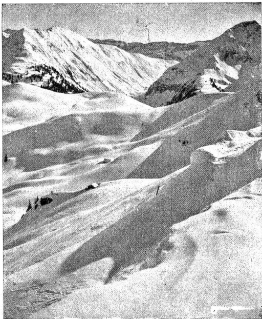
Blick vom Hornberg.

Heute ist das anders, man überläßt diese Orte fast ganz den Kranken und Erholungsbedürftigen. Wer noch warmes Blut in seinen Adern pulsieren fühlt, der strebt für einen Winteraufenthalt nach der Höhe, so 1000 bis 2000 Meter