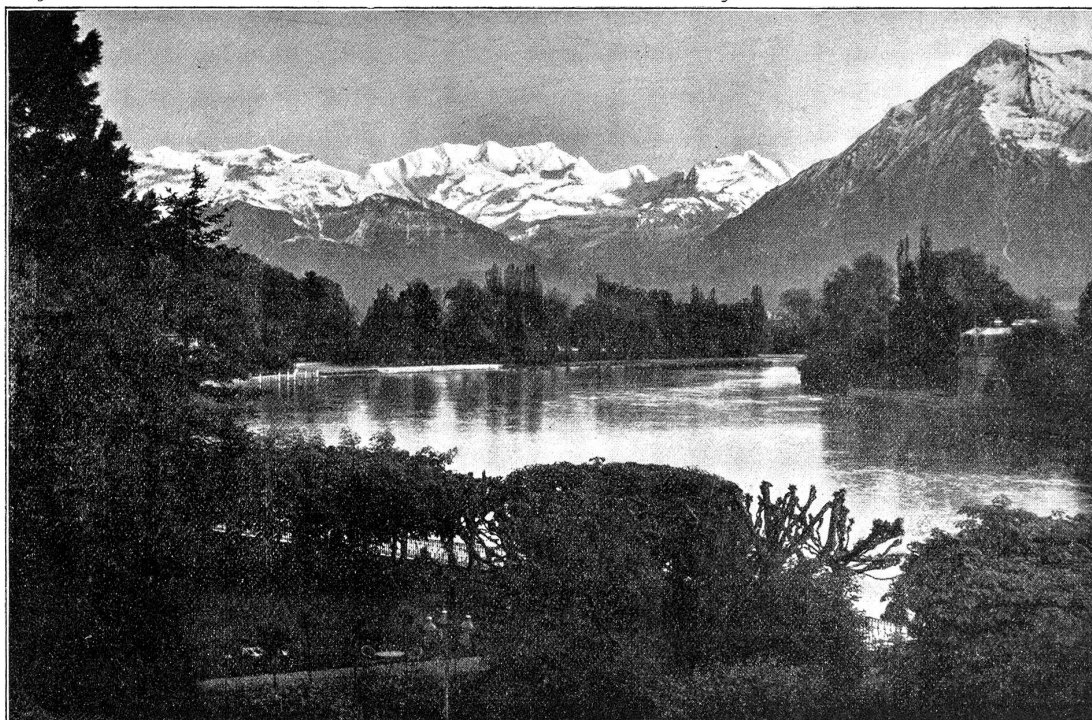
Thun. Blick von Hoffstetten über die Aare auf die Alpen.

Von den Entwürfen, welche bis jetzt ausgearbeitet worden sind, würde den Thunern das Projekt I unseres Planes am besten entsprechen. Bei seiner Ausführung käme die Zufahrt zum Bahnhof gegenüber dem Hotel Thunerhof zu stehen, und es wäre dabei eine befriedigende Befahrung des Aarebassins möglich, nur müßte die untere Insel wie die Scherzigenpromenade durchschnitten werden, was das Landschaftsbild leider stark beeinträchtigen würde.