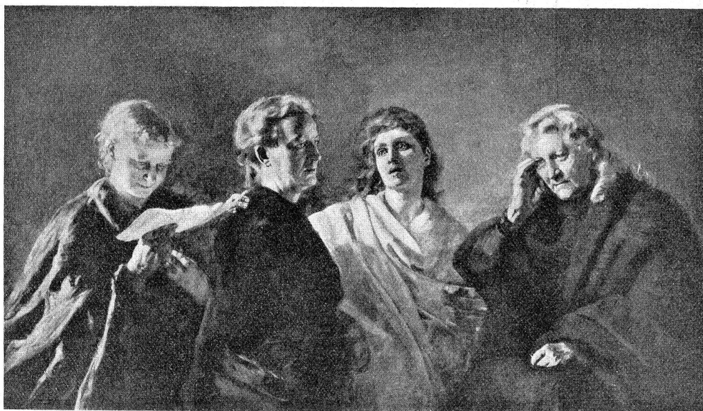
Sibyllen. Gemälde von Clara von Rappard.

In Wabern 1862 geboren, verlebte sie eine schöne Jugend an der Seite des als Naturforscher bekannten und um das Oberland hochverdienten Vaters und einer Mutter, die die Studien des Vaters und die Arbeiten der Tochter mit vollem Verständnis verfolgte. Wiederholte Reisen nach Italien, Deutschland, Paris, nach Konstantinopel und Griechenland — wovon sie im Sonntagsblatt des „Bund“ aufs Anmutigste berichtete — weckten und stärkten ihren künstlerischen Sinn.