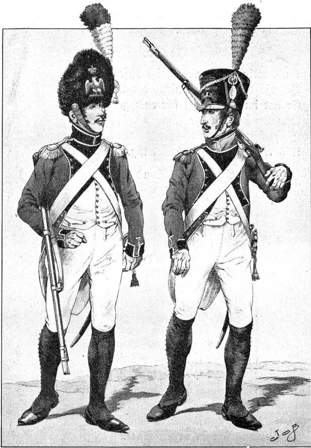
Grenadier. 3. (Berner) Regiment. Chasseur.

das Lob aussprechen zu können: es ist ein gutes Buch. Schon die Ausstattung. Francke pflegt nicht zu knausern und Hans Beat Wieland kann zeichnen. Dazu hat Hellmüller in weiser Beschränkung lauter zeitgenössischen Stoff für die