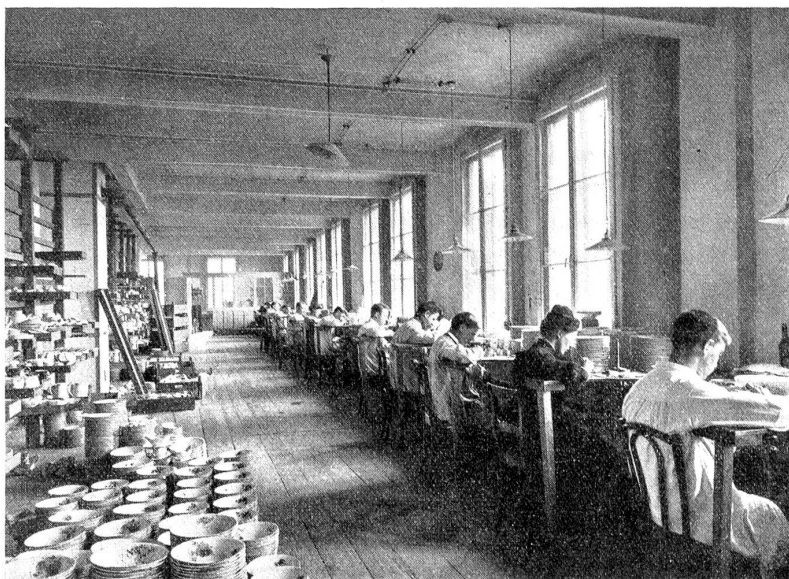
Porzellanfabrik Langenthal: Malerei.

Die Feuerung zur Erzielung dieser Hitze geschieht während ca. 30 Stunden durch Braun- und Steinkohle. Nach etwa zweitägiger Abkühlung können ca. 12,000 bis 15,000 Stück fertiges, weißes Porzellan aus dem Glattofen herausgeholt werden. Nun kommt es in die Sortiererei und wird in Qualitäten eingeteilt, in erste, zweite und event. dritte Wahl. Entweder gelangt nun das weiße Porzellan als solches