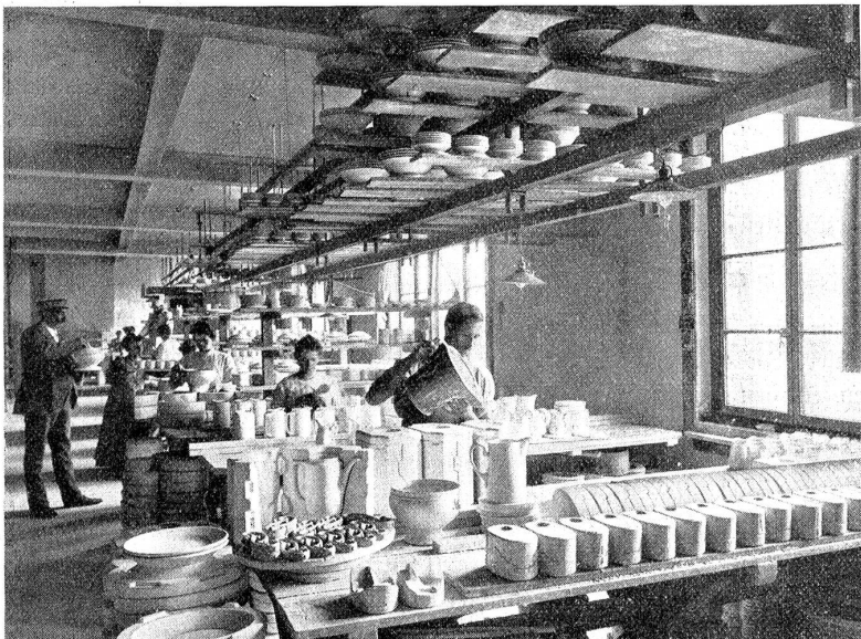
Porzellanfabrik Langenthal: Giesserei.

Das Porzellan ist eine Mischung dreier Bestandteile, nämlich von Kaolin (Porzellanerde), Feldspat und Quarz.