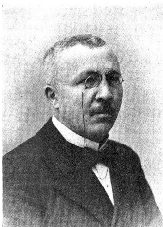
Bundesrichter Dr. Rossel.

Und drittens wurde die Einführung von Postlagerarten mit einmonatlicher Gültigkeitsdauer beschlossen. Die Gebühr für dieselben wurde auf 30 Rp. festgesetzt. Diese Postlagerarten dienen als Ausweis für die Erhebung von postlagernden Briefen usw. Die Karten tragen nur den Poststempel der betreffenden Poststelle und eine fortlaufende Nummer, die statt der Adresse auf den Briefen angegeben werden kann. Es sind das Neuerungen, die sicher nicht nur von der Geschäftswelt begrüßt werden dürften.