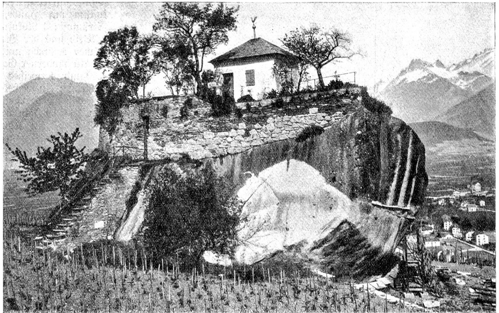
„Pierre des Marmettes“ bei Monthey, Unterwallis. *)

sehen von den der Modetorheit unserer Damen geopfertem Vögeln, haben diese auch den veränderten Lebensbedingungen der Menschen weichen müssen. Die Vernichtung der Feldhecken, das Entfernen des Unterholzes im Walde, das Ausmerzen der alten, hohen Bäume, das Regulieren der Bäche und Flüsse beraubt die Vögel ihrer gewohnten Brutstätten und verdrängt sie dadurch immer mehr aus unsern Länden. Und die Flora! Nur ein Beispiel wollen wir hier geben. Letztes Jahr nahm sich ein Mitglied des schweizerischen Alpenklubs die Mühe, die vom Glärnisch heimkehrenden Sonntagstouristen nach ihrer Edelweißausbeute zu fragen. Er begegnete an zwei Tagen 51 Touristen, welche zusammen nicht weniger als