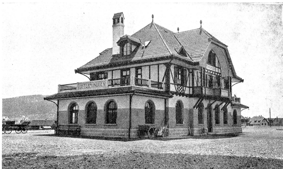
Das neue Stationsgebäude in Ostermundigen.

verrät entschiedenen Sinn für das Heimatgefühl. Es enthält zwei Wartsäle, einen besonderen Raum für die Güterpedi-