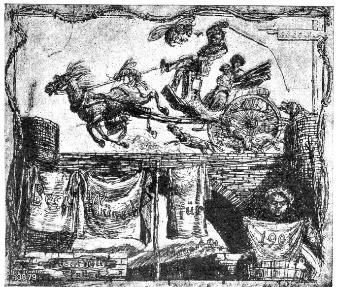
Glückwunschkarte des Künstlers für Neujahr 1901.

Albert Welti hat es nur auf fünfzig Jahre gebracht. Vom Photographenlehrling ist er zur Kunst übergegangen, als Böcklinschüler hat er begonnen und als freier, großer Meister ist er gestorben. Sein Leben lang gütig, freundlich