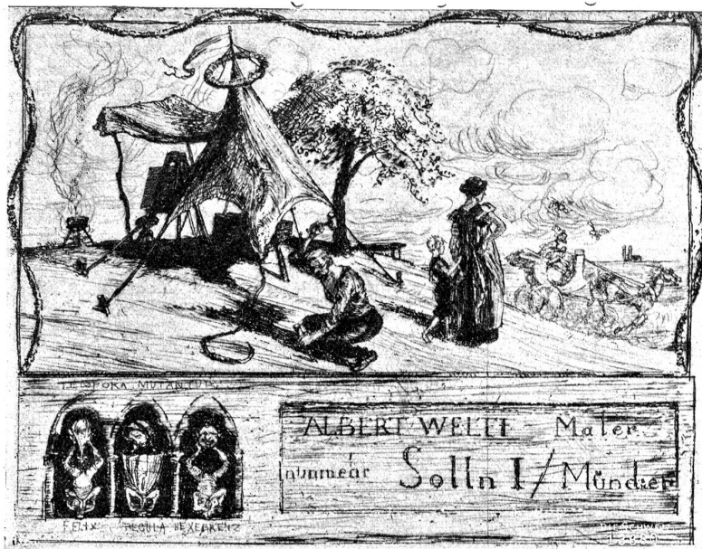
Postkartengruß des Künstlers aus Solln I bei München (Sommer 1901).