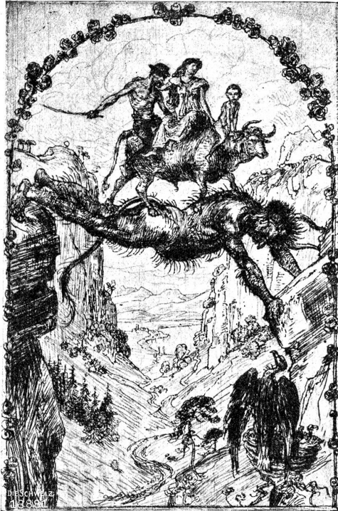
Glückwunschkarte des Künstlers für Neujahr 1902.

Morgenlicht um den Hoffenden, die Glut des leidenschaftlichen Träumers, der fahle Lampenschein des Entfagenden. Bloß ein