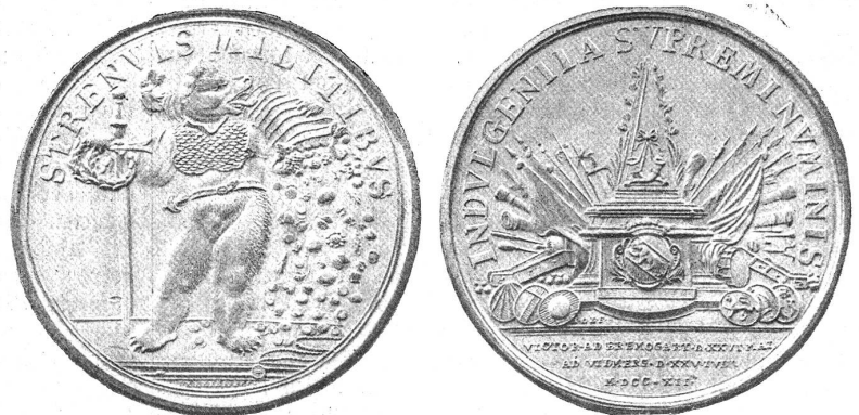
Die an die Offiziere des siegreichen Heeres verteilte Medaille.

Einzig Nidwalden hatte rundweg die Ablehnung des Vertrages erklärt, Zug schwankte — da setzte namentlich in Schwyz und Zug die Wühlarbeit der Kapuziner ein, die den Religionskrieg erklärten und es wirklich dazu brachten, daß am 19. Juli 4000 Schwyzer, Unterwaldner und Zuger nachts bei Gislikon über Luzernergebiet zogen, die bernische Abtheilung an der Sinerbrücke andern Tags angriffen und mit einem Verlust von ungefähr 100 Toten verjagten. Auf dieses Signal hin flammte der Kriegseifer auch in Luzern wiederum auf, wo der Landsturm erging und unter den Augen der Regierung die Kanonen aus dem Zeughaus geholt wurden; ja, der Amtschultheiß Schwyzer selber stellte sich an die Spitze der ungefähr 4000 Mann, die jetzt aufbrachen. Trotz des schlechten Wetters vereinigte sich die katholische Macht am 22. vor Wohlten, aus dessen Mauern am Tag vorher das Bernerheer sich nach Villmergen zurückgezogen hatte. Nachdem heftige Regengüsse zweimal den geplanten Angriff auf die Keyser verunmöglicht hatten, kam es endlich am 25. Juli 1712 hinter