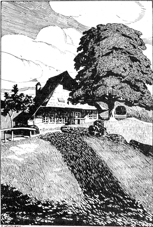
Das „Hubelhus“ in Ostermundigen.