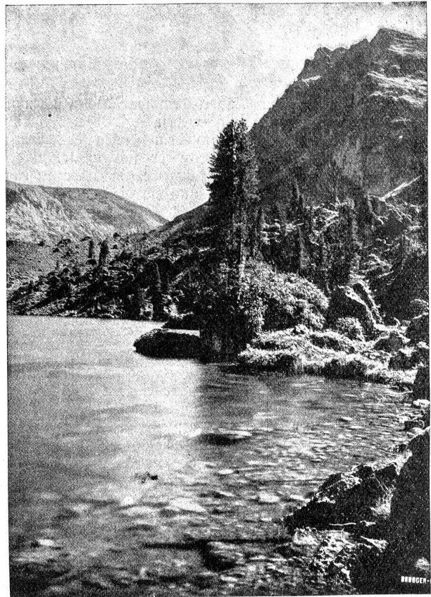
Seebergsee bei Zweisimmen.

Die streitbare Jugend von der Lenk war ins Feld gezogen fürs Vaterland; Weiber und Kinder und die ältern Männer waren allein zu Hause geblieben, um das Vieh zu