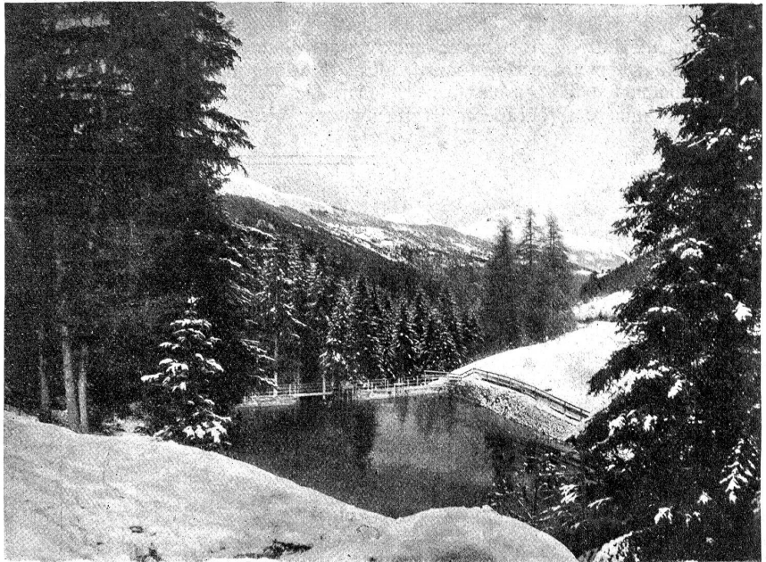
Talsperre in Churwalden: Ansicht der Staumauer von der obren Seite mit Kieschleufe und Einlaufschleufe, sowie Stauweiher mit Ueberfall.

Die Stauung von Gewässern mittelst gemauerten Sperren oder Erddämmen ist eine Tradition uralter Zeit, in der heißen Zone bedeutete die Wasserfrage eine Existenzfrage für die landwirtschaftliche Bewässerung und die Trinkwasserversorgung. Im Mittelalter schenkte besonders Spanien den gemauerten Sperren zum Zwecke der Bewässerung alle Aufmerksamkeit, während Deutschland Erddämme für die Gewinnung von Wasserkraft erstellte. In neuerer Zeit ist es besonders Frankreich, das die gemauerten Sperren angewendet hat, die denn auch vorbildlich wurden. Diese stauen das Wasser für die Speisung von Schiffahrtskanälen, für die Wasserversorgung von Städten und die Bewässerung von Ländereien. Die in den letzten Jahrzehnten in Deutschland erbauten Talsperren dienen zur Aufspeicherung von Wasser zu Kraftzwecken, für landwirt-