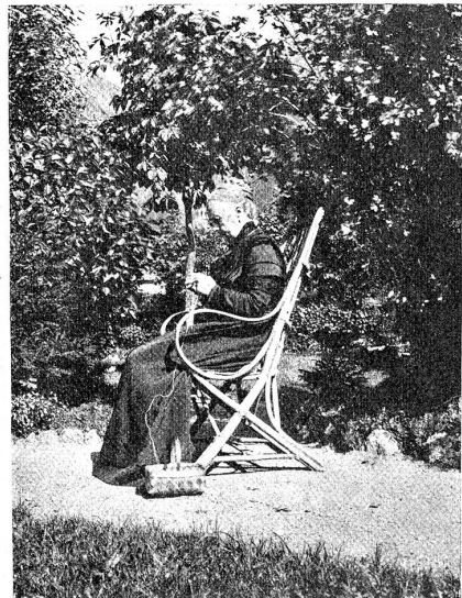
Die Mutter des Dichters.

Anno 1893 erschien mein erstes Buch, eben diese „Kämpfe“. Es brachte mir kein Honorar; der Wunsch, ein Buch meinen Namen tragen zu sehen, ließ mich vergessen, daß es Dinge wie Verlagsverträge gibt; die Kritik hat ja auch das Buch nach Gebühr und sicherlich mit Recht zerzaust. Aber ich durfte dieses mein erstes Buch meiner lieben kleinen Braut als Hoch-