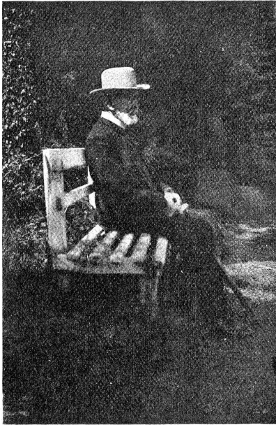
Der Vater des Dichters (Geft. im Februar 1912).

Möge es gewesen sein, daß eine bessere Kraft sich in mir regte, mag es sein, daß die neuen Lehrer mir mehr Liebe und Verständnis entgegenbrachten — meine anderthalbjährige