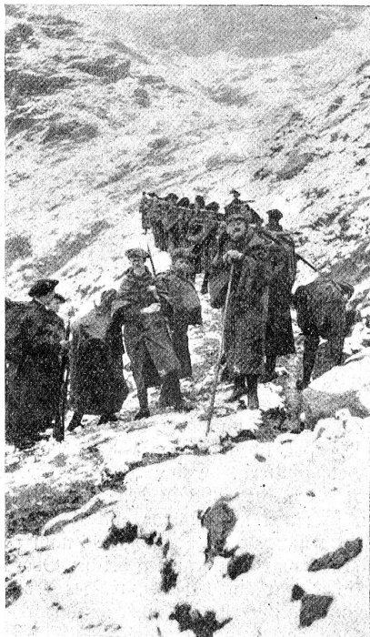
Auf dem Suften bei Schneegestöber.