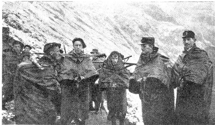
Auf dem Suften, 2. Tag. Die Zelttücher werden als Regenmäntel benutzt.

Vierter Tag: Morgens 2 Uhr werden wir von unserem kurzen, doch guten Schlafe aufgeweckt, aber keiner war unzufrieden, denn ein schöner Sternenhimmel versprach gutes Wetter. Eine Stunde später Abmarsch nach dem Rhonegletscher. Unter kundiger Führung wurde der interessante Gletscher traversiert und nach 3 Stunden belohnte uns auf der Paßhöhe des Nägelsgrätli ein gewiß jedem unvergeßlich bleibender Blick auf Berner- und Walliser-alpen. Nur zu früh mußte wieder aufgebrochen werden, lag doch noch eine große Strecke Weges vor uns. Hinab ging's durch steile Runsen, bald über Schneefelder rutschend, bald mühsam auf steinigem Pfad der Grimsel zu. Auf der gut gebauten Grimselstraße zur Seite der jungen, schäumenden Aare am vielbesuchten Handeckfall vorbei ging es dem idyllisch gelegenen Berg-dorfe Guttannen zu, wo unsere vorausgeeilten Küchenleute Suppe und Spaz bereit hatten.