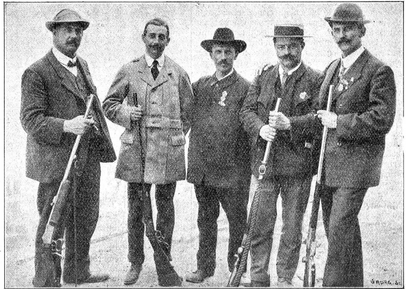
Die Schweizer-Schützen in Biarritz.

Diese Resultate, die bis jetzt noch nie erreicht wurden, machen uns stolz auf unsere Schweizer Match-Schützen. Ihnen kommt wohl in erster Linie das Verdienst des guten Rufes zu, den die Schweizer als Schützen im Auslande genießen, und der Respekt, den die Ausländer vor der Gewandtheit der Schweizer-Schützen überhaupt haben, dürfte zur Erhaltung unserer Unabhängigkeit nicht wenig beitragen. Mit einer einzigen Ausnahme (Turin 1898) sind die Schweizer in den 17 bisherigen internationalen Gewehr-Matches immer Sieger geworden.