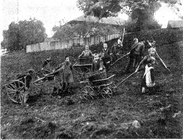
Blinde Knaben mit Feldarbeiten beschäftigt.

noch verhältnismäßig jüngern Datums. Die Geschichte nennt als erste europäische Blindenanstalt diejenige im Jahre 1784 in Paris errichtete, welche sich vorzüglich bewährt und rasche Nachahmung gefunden haben soll. In Bern wurde um das Jahr 1831 eine Privatblindenanstalt durch den erblindeten alt Großweibel G. E. von Morlot gegründet. Das Vorbild