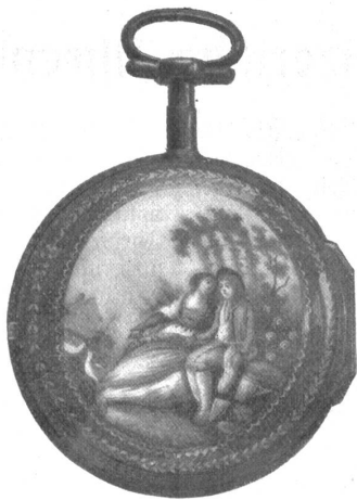
Emaillierte Uhr aus dem 18. Jahrhundert.

der Begründer der neuenburgischen Uhrenindustrie.