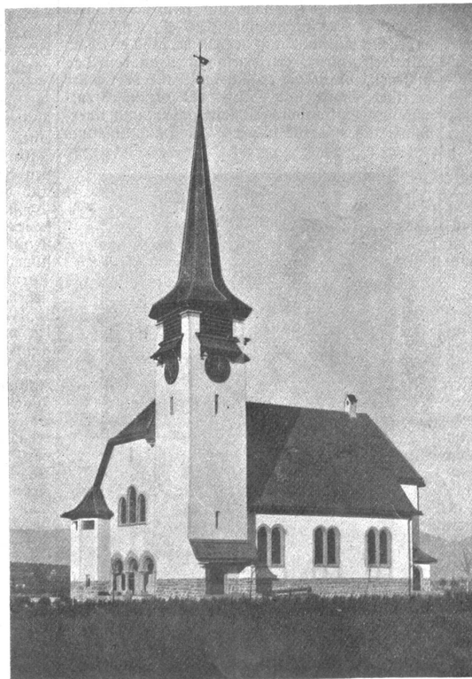
Die neue Kirche von Biberist-Gerlafingen.

Die drei bernischen Irrenanstalten bei Herberghen am 31. Juni 1913 insgesamt 1841 Kranke, nämlich Waldau 686, Münstingen 827 und die Anstalt Bellelay 328 Kranke.