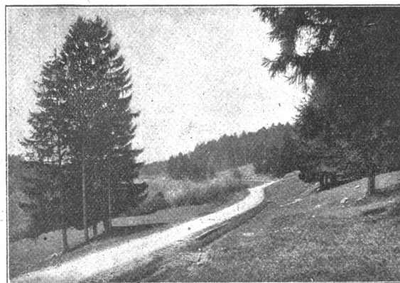
Wald und Weiden auf dem Tessenberg.

„Du weißt es ja, ich kann von Vaters Glauben nicht lassen.“ „Ich habe dich lieb, so wie du bist, Maria!“