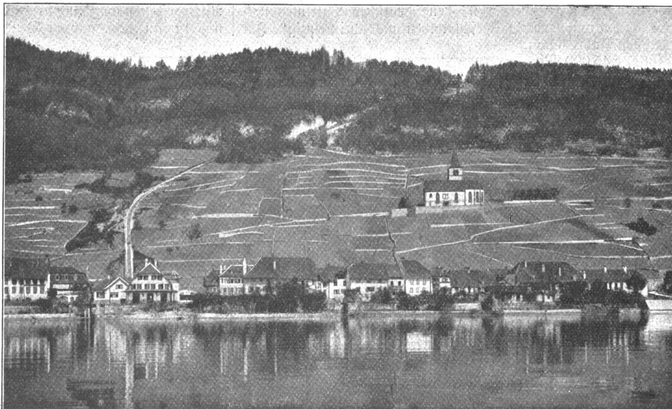
Ligerz, Stationen und Dampfschiffände.

Ueber allen Dächern, Schornsteinen und Siebelmauern hinweg winkt die Kirche von Ligerz das Willkommen herauf. Das ist nicht eine, die altersschwach, in sich zusammengesunken am Ufer steht, sondern eine, die trotz ihrer Jahrhunderte sich stolz und schügend über dem Dorfe erhebt und deren Turmspitze an hellen Tagen bis weit nach den Alpen sieht. 1261 soll sie gebaut worden sein; aber mein Gott, wer will es ermitteln, wie mancher Stein aus dieser grauen Vorzeit noch an ihr haften geblieben ist. Wohl liegen hinter ihr, unter dem niedern Schirmdächlein des kleinen Anbaues, wo das Gras in der Dachrinne wächst, alte behauene Steine, die Wappen und fremde Namen enthalten, sonst aber gemahnt an seinem Außern nichts an sein hohes Alter. Noch spät am Abend, als die Dämmerung schon begann ihre grauen feinmaschigen Netze um Häuser und Bäume zu schlingen, gelingt es mir durch die Liebeshwürdigkeit eines mit den Verhältnissen vertrauten alt Pfarrherrn, der allein das Ruheneß des versteckten Schlüssels kennt, das Innere der Kirche zu be-