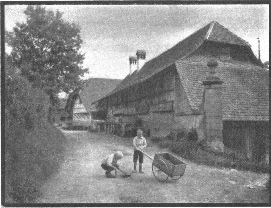
Bauernhaus in Ittigen bei Bern.