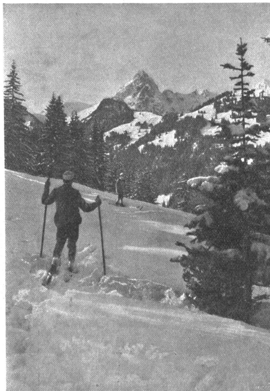
Winter bei Gstaad. — Blick vom Hornberg.

noch die Wirtschaften Licht hatten. Er suchte daran zu denken, daß ja noch gar nichts Schlimmes geschehen war. Aber