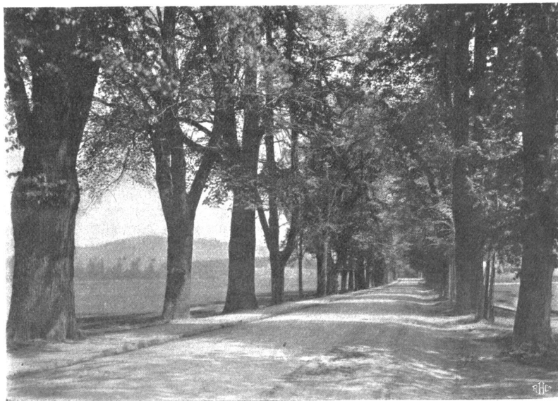
Allee an der Bolligenstrasse gegen die Waldau.

Heute sind diese Bäume schon ehrwürdige Veteranen, ihre Stammdicke läßt sie aber noch älter erscheinen, als sie wirklich sind. Die Enge, die Laupen- und Murtenstraße, die Holligenstraße, dann untenaus die Landstraßen nach der Papiermühle, nach Holligen, Ostermundigen und Muri und die beiden großen Stalden sind alle von Baumriesen beschattet, welche die Gnädigen Herren um 1760 herum haben pflanzen lassen.