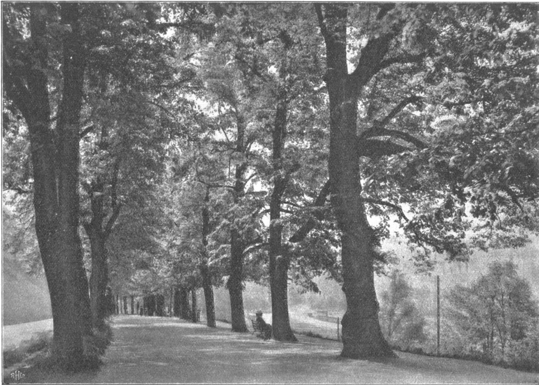
Allee am Murgauerstalden gegen die Stadt.

Herrlich wandelt sich's in diesen Laubhallen, wenn nicht gerade Pferderennen, Flugtage oder Fußballschlachten neben ihnen abgehalten werden und drangvolle Enge verursachen. Den Fremden wird man hier nicht finden, höchstens sauft er im Auto durch; umso lieber sucht der Berner in abendlicher Kühle oder im sonntäglichen Spaziergang seine Alleen auf, wo er allein daheim ist und nicht mit dem Fremdling Aus-sicht und Preise teilen muß.