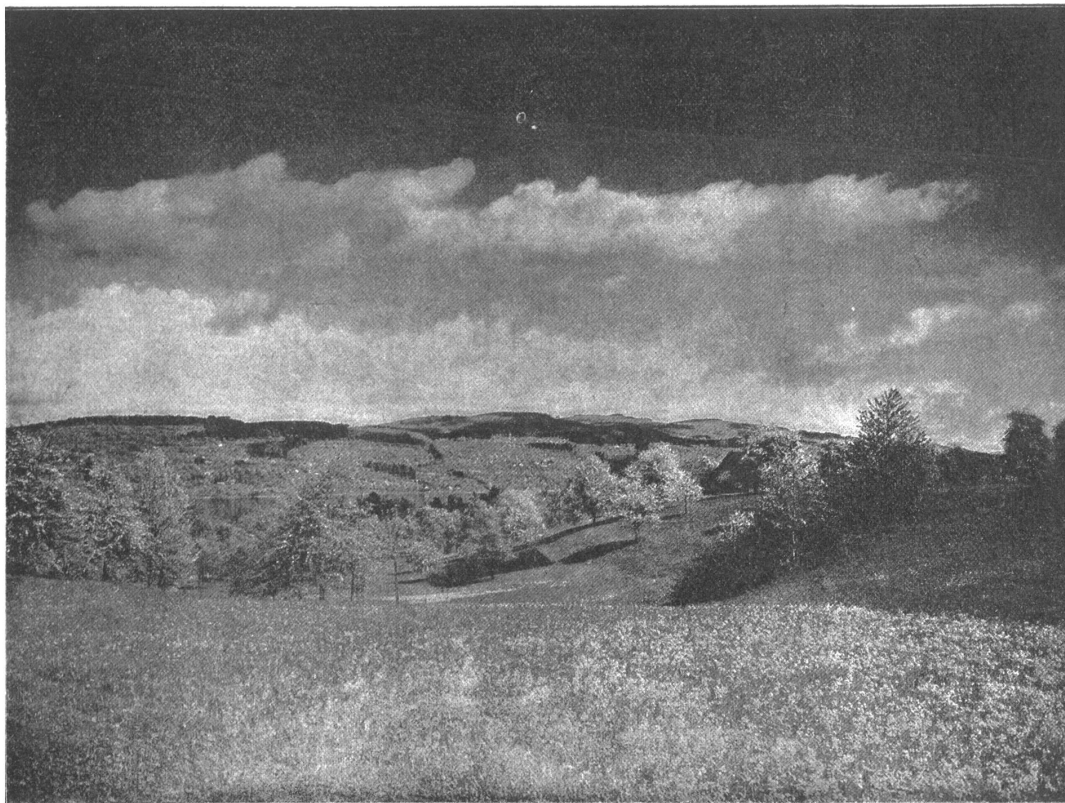
Maierpracht im Schweizer Mittelland. Motiv von Hertenstein.