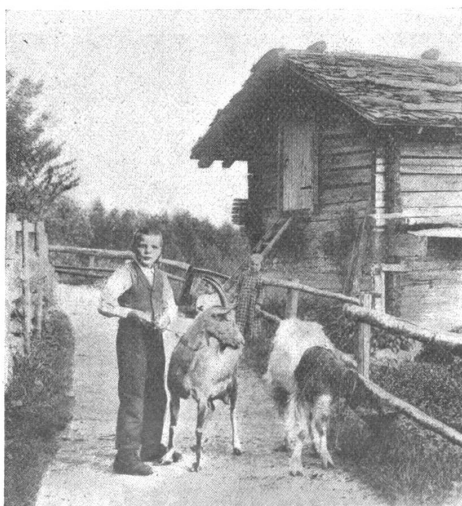
Auf der Dorfstrasse von Wilderswil.

In der Nähe Interlakens, der Metropole unseres vielbesungenen Berner Oberlandes, liegt, ungefähr 630 m über dem Meerespiegel, ein Dorf, das unbestritten zu den schönsten und anziehendsten unseres Bernerlandes zählt: Wilderswil.