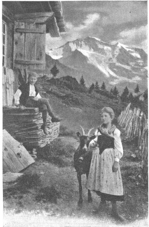
Dorf-Jagdli bei Wilderswil.

oder rechts von der Brücke ihre Staffeleien aufstellen, um ihrer Skizzensammlung ein neues, eigenartiges Stück beizufügen.