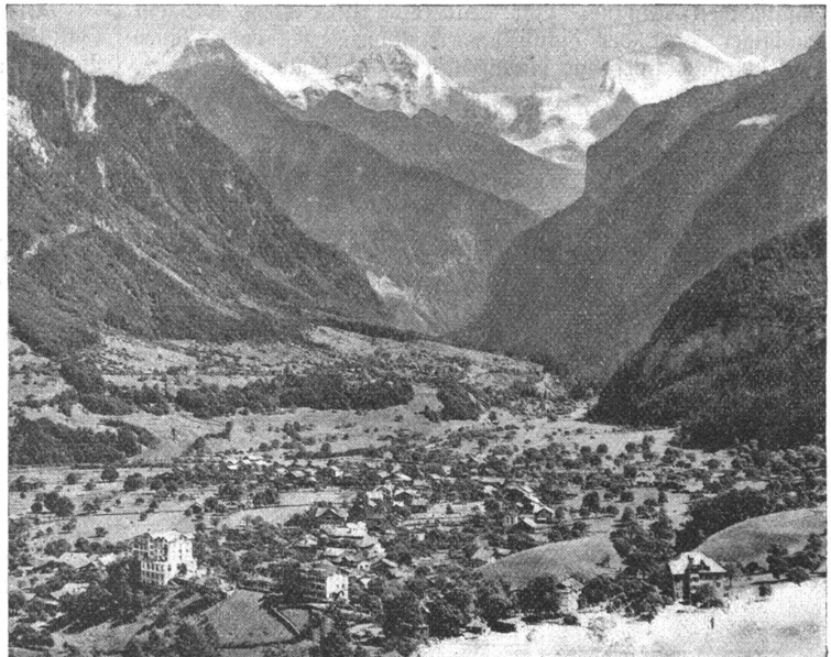
Wilderswil-Gsteig mit Eiger, Mönch, Jungfrau.

„Frauen sind für uns Männer die Erfüllung eines Glückes oder Unglücks im Leben. Jedenfalls, ohne sie können wir nicht recht bestehen. Ein Mann ohne Frau ist kein ganzer Mann und lebt kein volles Leben. Er ist wie ein Apfel, der nicht ganz ausreißt und vom Baume fällt und verdorrt, oder wenn es gut will, zu Mus gekocht wird. Die Köstlichkeit der vollen Kraft und Reife fehlt ihm. Es gibt nun Frauen, die sind wie süßes Gift. Sie gehen darauf aus, den Mann zu verderben. Haben Sie wohl acht vor solchen, Herr Spätzlein. Und es gibt Frauen, die sind gut und innig und wie vom lieben Herrgott in die Welt gegeben, zu trösten und Schmerzen zu lindern. Vornehmlich