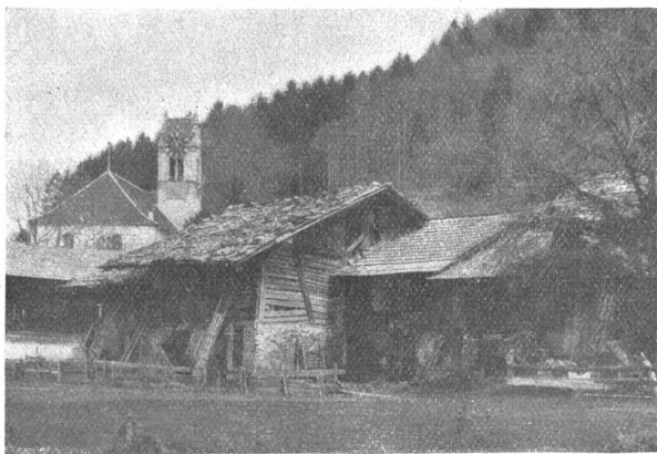
Kirche von Gsteig.

In südöstlicher Richtung von Unspunnen aus, am Fuße der „Schynige Platte“ steht die alte, weithin sichtbare Kirche von Gsteig. Auf einer kleinen, aussichtsreichen Anhöhe am rechten Ufer der Lüttschine überragt sie das Bödeli. Schon die alte hölzerne Brücke (früher war es eine steinerne) die