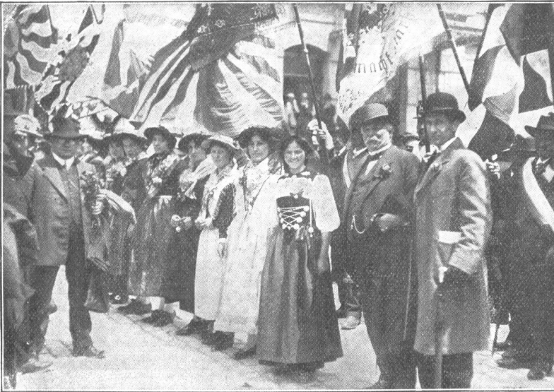
Von der Einweihung der Lötschbergbahn: Der Empfang in Brig.

blickten wir mit hoffnungsvollen Augen zum Himmel empor, damit den Wunsch verbindend, Petrus möge uns wenigstens mit seinem Raß verschonen. Und es geschah. Das Wetter hielt sich während der ganzen Reise leidlich, wenn auch die Gipfel der Berge unter Neuschnee lagen oder vom Nebel verdeckt wurden.