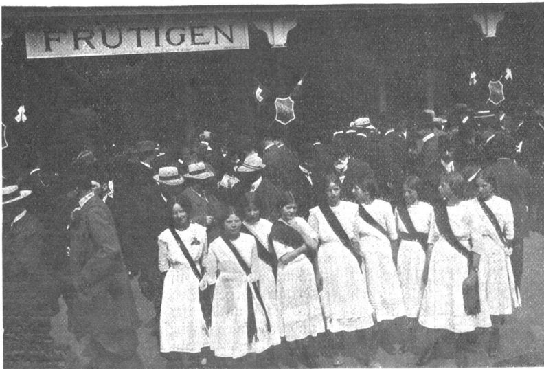
Von der Einweihung der Löttschbergbahn: Der Empfang in Frutigen.

Es regnete in Strömen, als am Samstag morgen der Bundesrat, die auswärtigen Gäste, die Leiter des Löttschberg-Unternehmens, das diplomatische Korps, die Presse mit den übrigen Geladenen sich zum Bahnhof begaben, um in zwei Sonderzügen nach Brig zu fahren. Aber einige optimistisch gestimmte Wetterpropheten wollten in der vergangenen Nacht klaren Sternenhimmel gesehen haben, und so