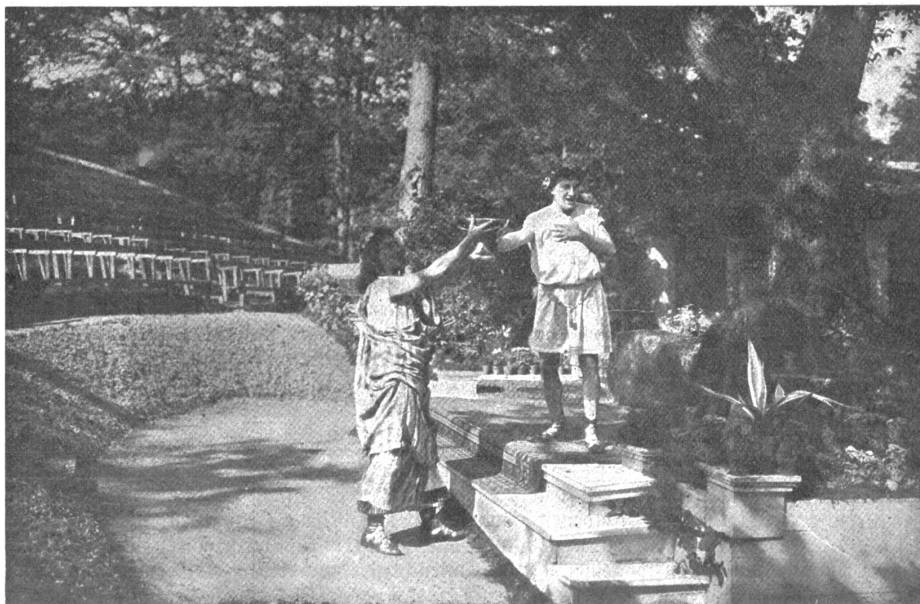
Freilichttheater in Bertenstein. Szene aus des „Meeres und der Liebe Wellen“. — (Text hierzu auf Seite 238.)

Jetzt, als der Alte wieder einmal über die weiten Felder ging, erinnerte er sich an ein Schelmenstück des Jungen. Der war damals so eine Art Studiosus auf Ferien, zu jeglichem Schabernack aufgelegt, aber auch zu ernsthaften Dingen bereit, wie etwa solche sind, an