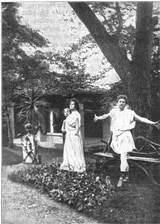
Freilichttheater in Bertenstein. Szene aus „Sappho“. (Text hiezu auf Seite 238.)

ging, seinen Rat zu erfragen, wie sie den Knaben studieren lassen könnte so, „daß es nichts tät' kosten“. Der Dechant von Birrfeld wollte ihm Unterricht in Latein erteilen. Peter kam zu diesem Zwecke nach Birrfeld zu einem Bauer. Er hielt es nicht lange aus. Das Heimweh trieb ihn schon nach drei Tagen nach Hause. „In jenen Tagen“ — so schreibt der Selbstbiograph — „ist mein Heimweh geboren worden, das mich seither nicht verließ, auf kleinen Touren wie auf großen Reisen in Stadt und Land mein beständiger Begleiter war und eine Quelle meiner Leiden geworden ist.“