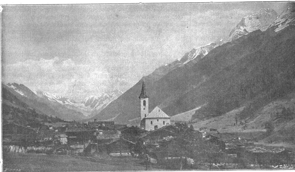
Löttschbergbahn: Kippel im Löttschental mit Biettschhorn.

sich in Bewegung. Ein Pfiff — Dunkel empfängt uns, wir sind im Tunnel. — Was bietet diese Tunnelfahrt? Doch wohl