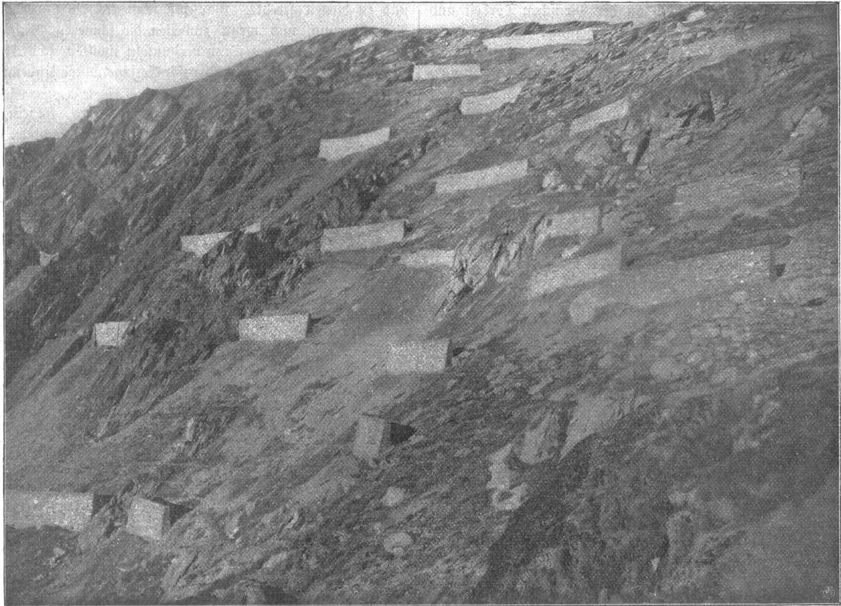
Lötschbergbahn: Die Lawinverbauungen bei Goppenstein.